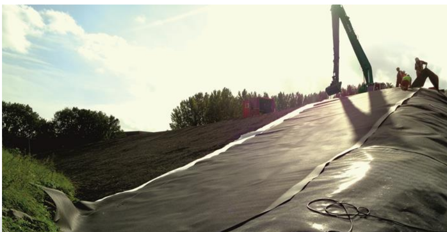
Foto: overzicht aanleggen IBC werk.

Het is niet mogelijk om accreditatie te verkrijgen voor dit schema, versie 2.0 in combinatie met protocollen met een lager versienummer dan 2.0.